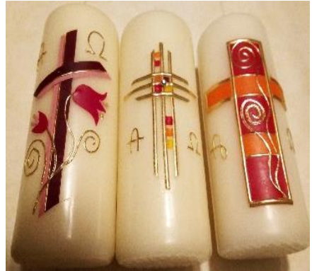
April Osterverkauf im Pfarrheim