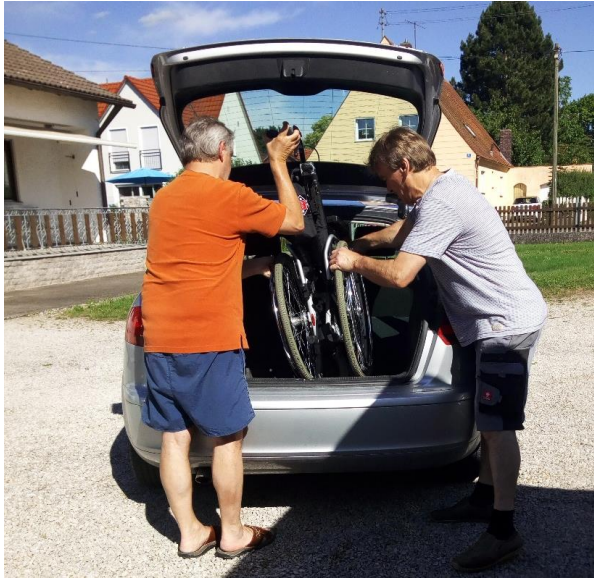
Juni Rumäniensammelaktion und Transport von Hilfsgütern