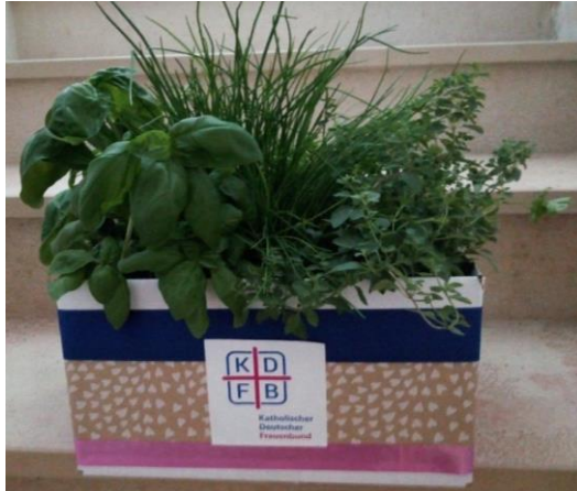
Juli Kräuterbox für junge Mütter im Familienhaus Alte Mühle in Waidhofen