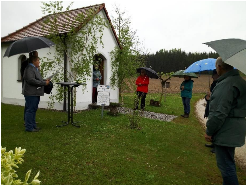
Mai Maiandacht an der Kapelle von Schenkengrub