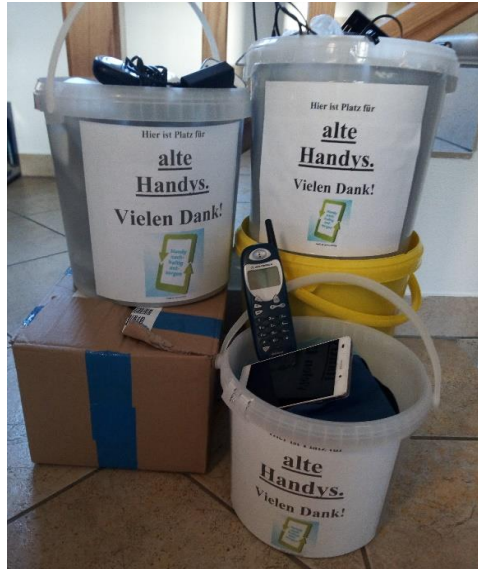
Januar – März Handysammelaktion