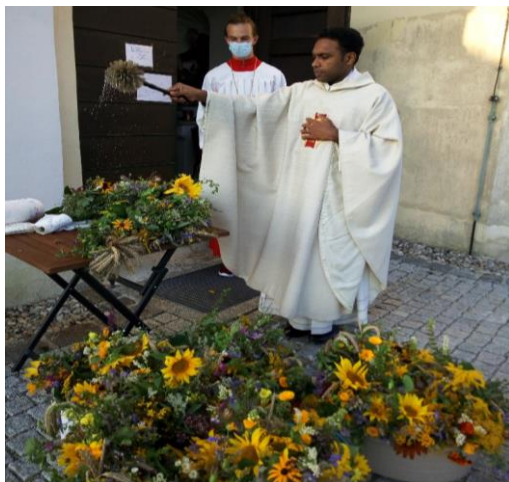
August Segnung der Kräuterbuschen