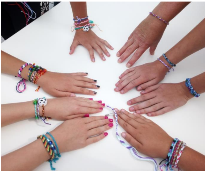
August Teilnahme am Ferienprogramm Knüpfen, Flechten und Kordeln von Armbändern