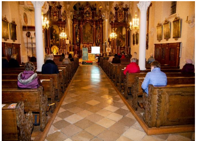
März Weltgebetstag mit Abstand – Vanuatu 2021