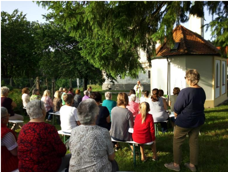
Juli Gottesdienst an der Kapelle von Loch